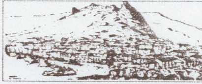
56368 Katzenelnbogen, Im Vogelsberg 11,